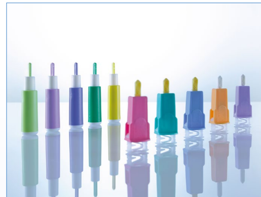
Lancets are colour-coded for easy identification of puncture depth and application.

Bezpečnostný mechanizmus zaisťuje, že čepielka/ihla je automaticky zasunutá po vpichu a je bezpečne uzavretá v plastovom púzdre. Najmä ak sa jedná o našich najmenších pacientov je potrebné, aby bola procedúra čo najjemnejšia, aby nedochádzalo k zbytočnému strachu. Bezpečnostný mechanizmus znamená, že čepielka/ihla je skrytá, čo umožňuje, aby sa odber uskutočnil vo viac uvoľnenej atmosfére pre všetky zúčastnené strany.